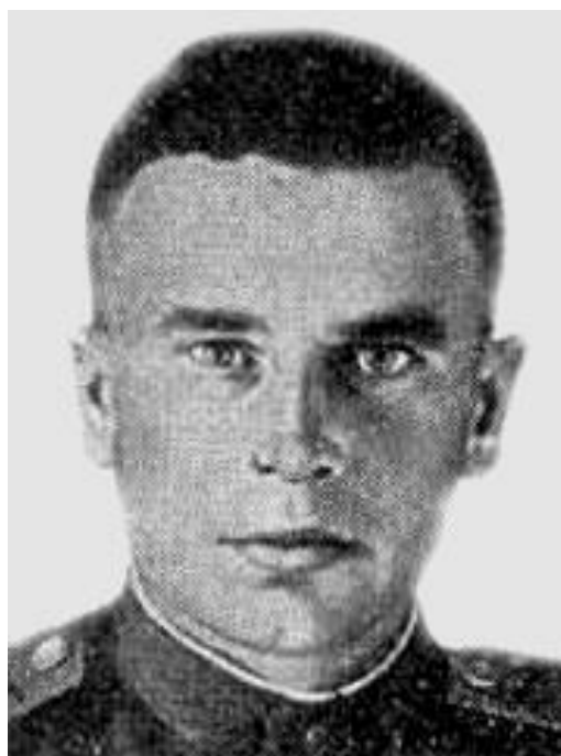
Герой Советского Союза В.Е. Капитонов, 10 ГБАП